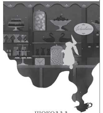
ШОКОЛАД ДЖОАНН ХАРРИС